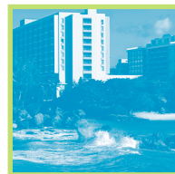
Condado Plaza Hotel & Casino, nuestro hotel sede.

13-14 DE JUNIO 2006 | CENTRO DE CONVENCIONES DE PUERTO RICO | SAN JUAN, PR